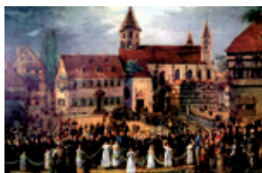
Zug der Generalsynode 1818 in die Stiftskirche Kaiserslautern, in der das erste gemeinsame Abendmahl der Reformierten und Lutheraner gefeiert wurde

Dass sich dieses Jubiläum direkt an das Reformationsjubiläum anschließt, ist damals wie heute kein Zufall. Die Union stand